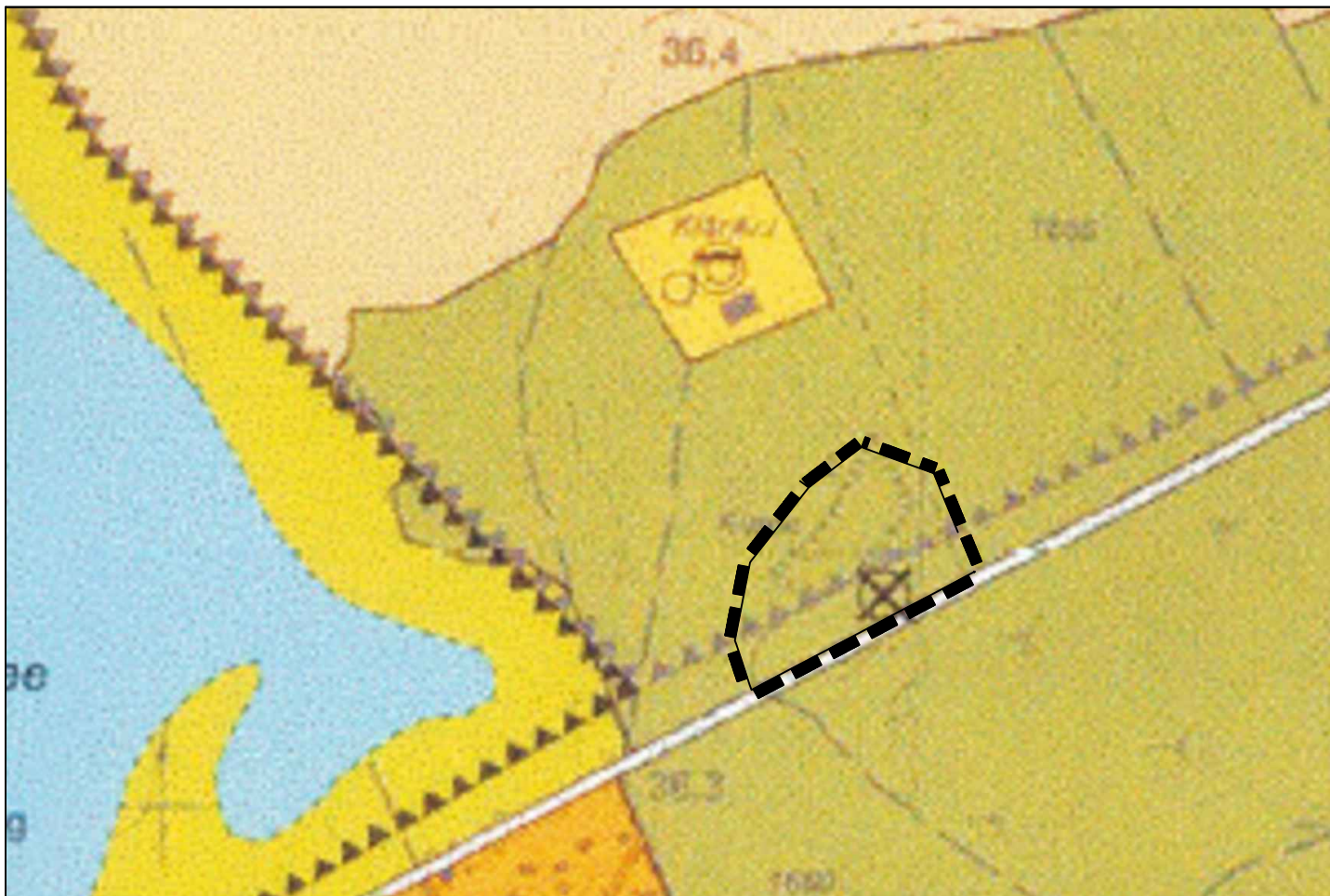
Wirksamer Flächennutzungsplan der Gemeinde Marienwerder (Stand 04/2021) mit Darstellung des Geltungsbereichs der 1. Änderung