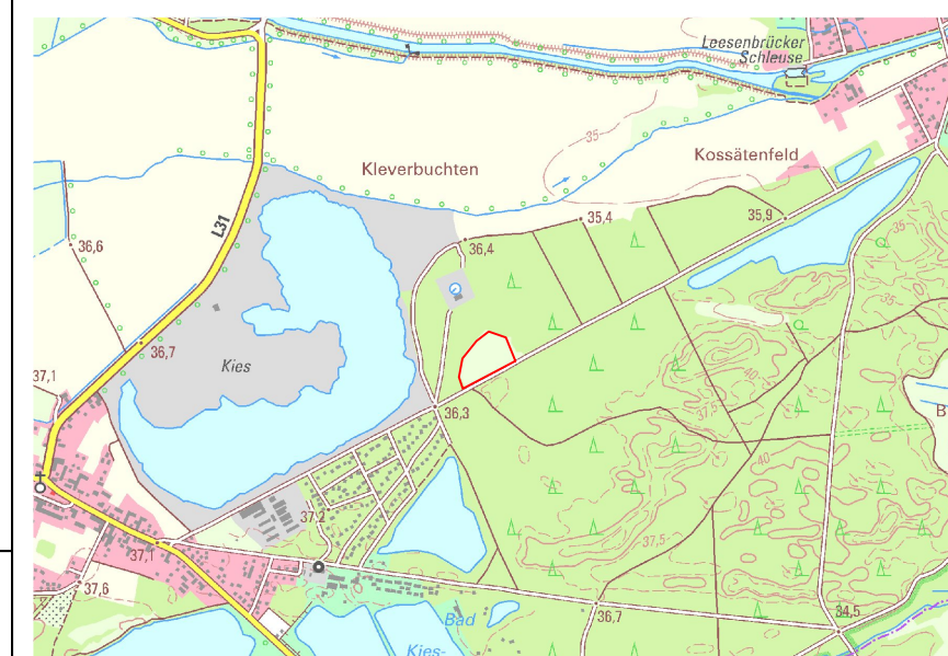
Übersichtskarte, Maßstab 1: 25.000

Planzeichenverordnung (PlanZV 90) i. d. F. der Bekanntmachung vom 18. Dezember 1990 (BGBl. 1991 I S. 58), die zuletzt durch Artikel 3 des Gesetzes vom 4. Mai 2017 (BGBl. I S. 1057) geändert worden ist.