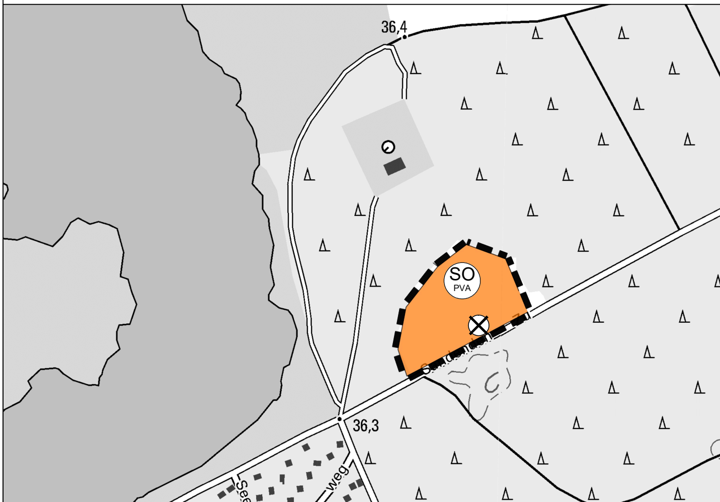
Darstellung der 1. Änderung des Flächennutzungsplans der Gemeinde Marienwerder